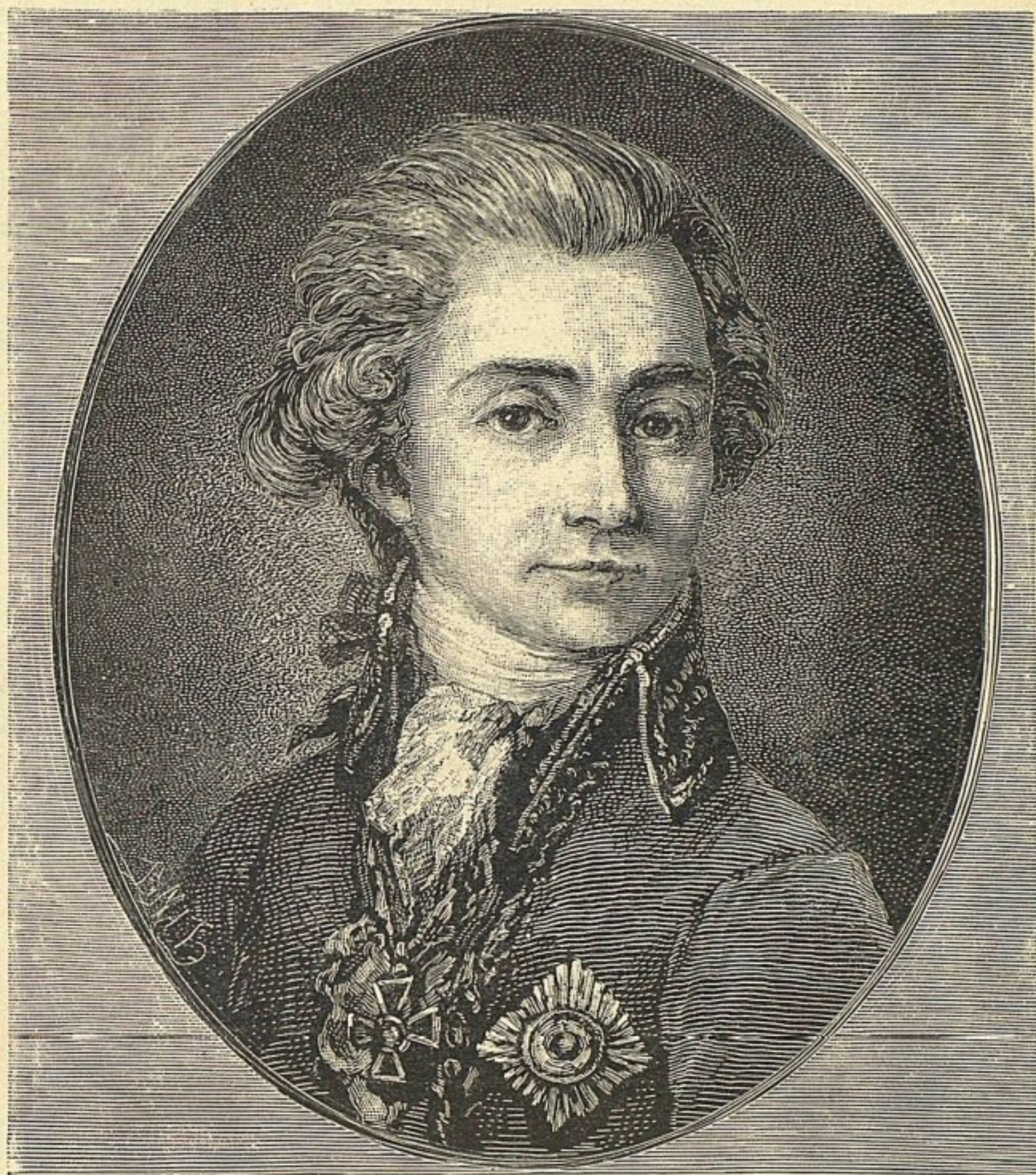
Иванъ Максимовичъ Синельниковъ.